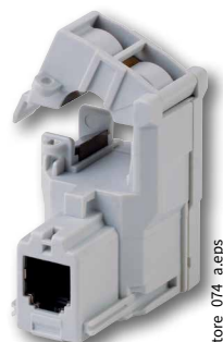
TR开合式电流互感器